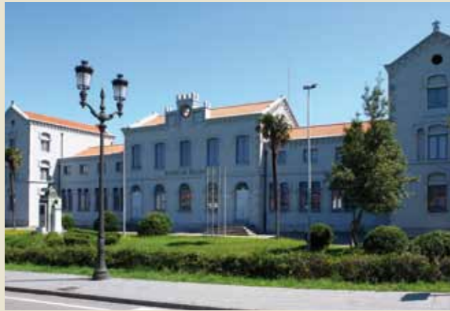
Fachada Escuelas Selgas