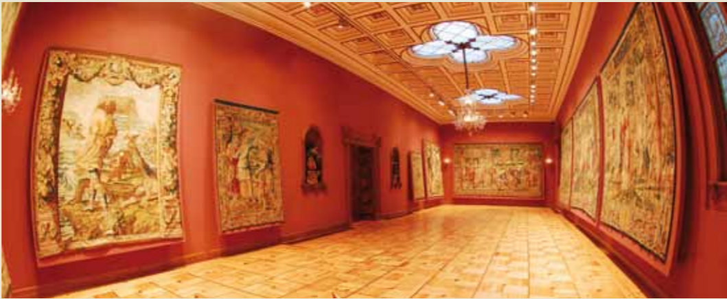
Interior del Pabellón de los Tapices