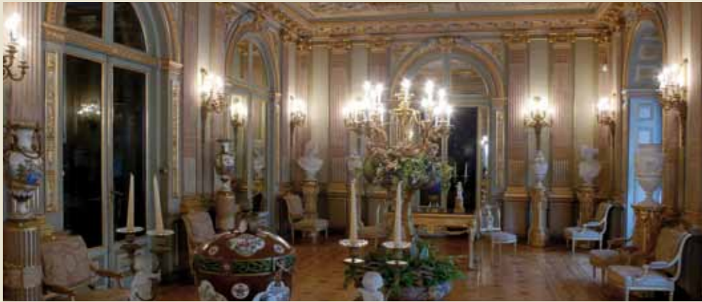
Interior de la Sala Luis XVI o Salón de Baile