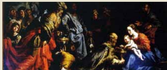
Detalle del cuadro "Adoración de los Reyes Magos"

Localizado en la localidad asturiana de El Pito (Cudillero), el Palacio de Los Selgas -La Quinta-, alberga un importante patrimonio artístico, el legado de la familia Selgas-Fagalde. A finales del siglo XIX , los hermanos Ezequiel y Fortunato de Selgas y Albuerne reunieron en este conjunto arquitectónico una magnífica colección de obras de arte.