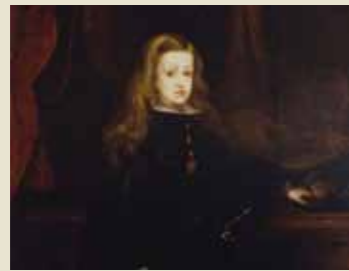
Detalle del cuadro "Retrato del Infante Carlos II, el Hechizado"