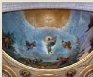
Fresco de la Transfiguración de Cristo