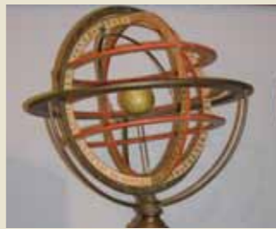
Esfera armilar o planetario