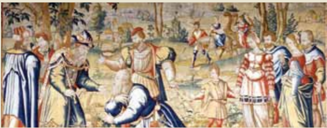
Detalle del tapiz "Jacob es presentado por José al faraón"