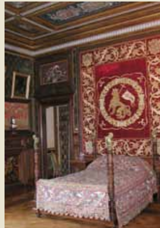
Izquierda: Alcoba Leones