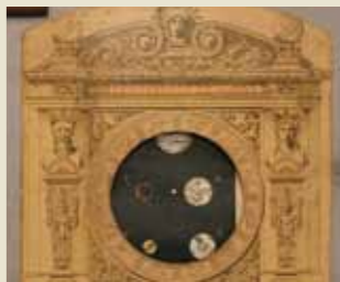
Observatorio de Salón