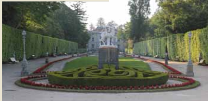
Vista del Jardín Francés