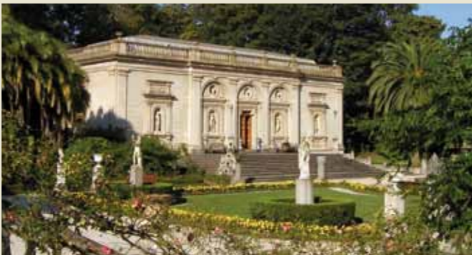
Fachada exterior del Pabellón de los Tapices