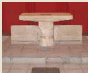
Altar del Rey Silo

En su frente se encuentra la imagen de la virgen, en mármol, recuperada por Fortunato de Selgas de la demolición de la Iglesia de la Santísima Trinidad de Madrid obra del escultor Miguel Ángel Naccherino. En el ábside de la cripta está el altar procedente de Santianes de Pravia, con su Cancel, cuyo original, que junto con el de Santa Cristina de Lena es uno de los mejores ejemplos del arte visigodo en Asturias, también se exhibe en La Quinta.