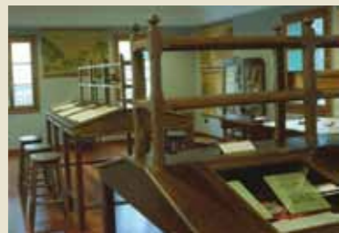
Vista de la planta superior del Museo Escolar

En él se exhibe una colección de objetos didácticos, usados durante la primera mitad del siglo XX en las Escuelas Selgas. Fundadas en 1915 como institución benéfica y docente, su objetivo era facilitar el acceso a la enseñanza a los niños y jóvenes de la villa de Cudillero.