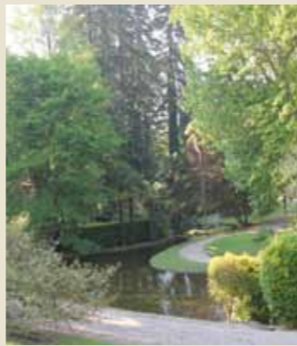
Rio del Jardín Inglés