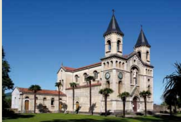
Vista de la Iglesia Jesús Nazareno

La Iglesia-Panteón Jesús Nazareno se encuentra localizada fuera del recinto de La Quinta. Su construcción data de 1914, fecha en que fue inaugurada por la infanta D a Isabel de Borbón.