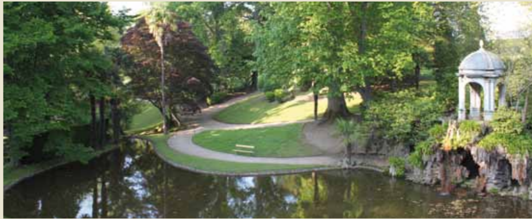
Vista del templete sobre el lago del Jardín Inglés