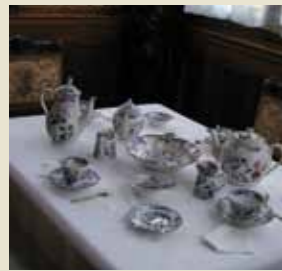
Comedor de verano